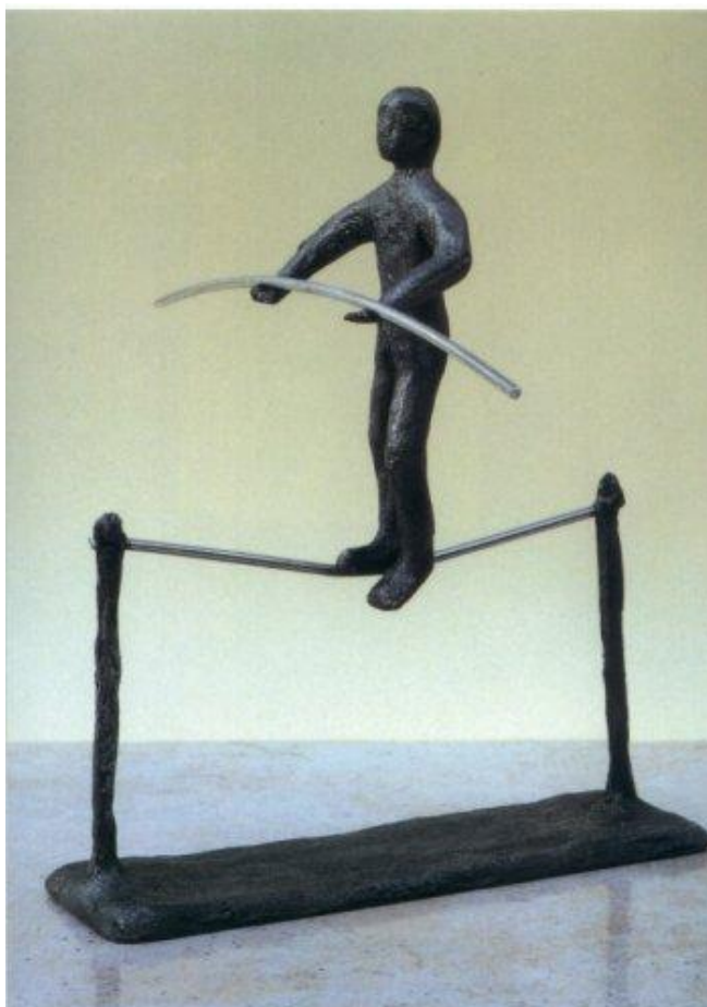
Beeldje uit Lioba, Egmond.