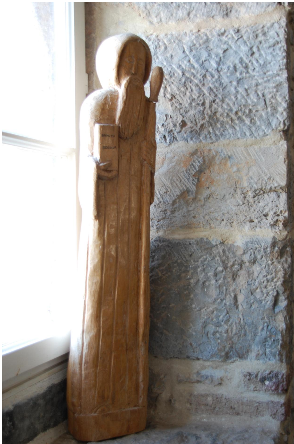
Benedictusbeeld in Rochefort