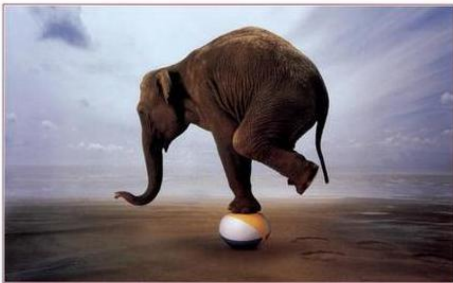
The Key to Life is Balance